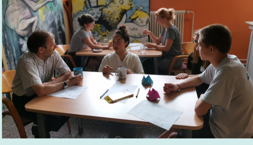
Begegnungscafé: Austausch über das Thema "Erste Liebe", angeleitet von der Künstlerin Yini Tao, im SPIKE, 27. August 2020

Laufzeit Mai bis Dez. 2020 Träger Kultur Aktiv e.V. Projektleitung Dr. Verena Böll Künstlerische Leitung Elena Pagel, Nazanin Zandi